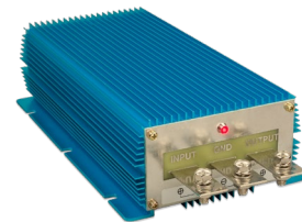
Orion IP67 24/12-100 Orion IP67 12/24-50