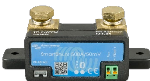
Detección Bluetooth: SmartShunt