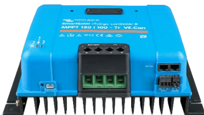
Controlador de carga SmartSolar MPPT 150/100-Tr-VE.Can sin pantalla