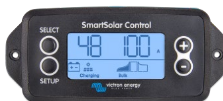
Pantalla conectable SmartSolar

Simplemente retire el protector de goma del enchufe de la parte frontal del controlador y conecte la pantalla.