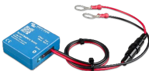
Sensor Bluetooth: Smart Battery Sense