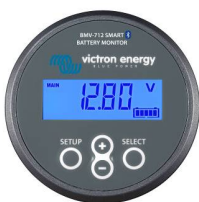
Sensor Bluetooth: Monitor de baterías BMV-712 Smart