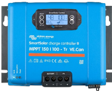
Controlador de carga SmartSolar MPPT 150/100-Tr-VE.Can con pantalla conectable opcional