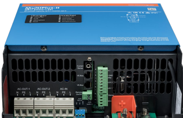
Área de conexión